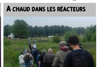
A CHAUD DANS LES RÉACTEURS

A l'occasion d'un projet contre le harcèlement, j'ai participé à un atelier organisé par le Croquemitaine et mon école VAL-ITMA.