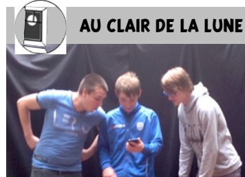
AU CLAIR DE LA LUNE

Fonds Vautours : victoire totale contre NML Capital et son dirigeant milliardaire Paul Singer.